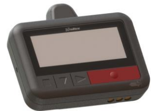
Notruf-Pager ESPAG mit Display und allen Alarmfunktionen (Schutzart IP67)