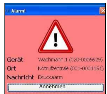
Rufübertragung auf das interne PC- Netzwerk